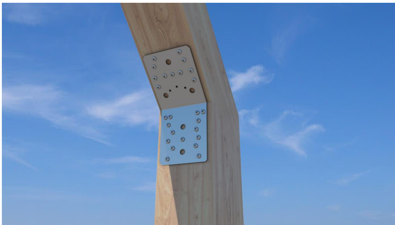
AB 135° 105 Cod. 390201105903

Tutte le informazioni si basano sulle conoscenze alla data di pubblicazione. La Borgia Italia srl si riserva il diritto di modificare e non si assume alcuna responsabilità per eventuali errori di battitura. Il progettista è tenuto ad assicurarsi dell'idoneità e della completezza di tali informazioni in relazione all'utilizzo specifico che deve fare del prodotto.